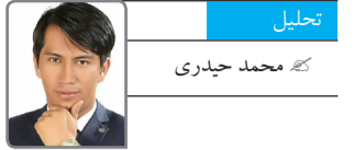
تحلیل محمد حیدری