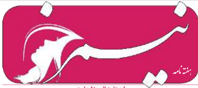
این‌جا، چراغی روشن است

سال دوم شماره ۴۵ دوشنبه ۲۵ سرطان ۱۳۹۷ قیمت ۱۰ افغانی Monday July 16, 2018 Vol. 2 No. 45