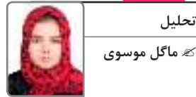
تحلیل ک ماکل موسوی

اگر توجه، تلاش و کارهای را که بانوان به دلیل حفظ بکارت می‌کنند، به خاطر مطالعه، ورزش و مسایل مهم‌تری انجام می‌دادند ما چگونه زنده گی می‌کردیم؟!