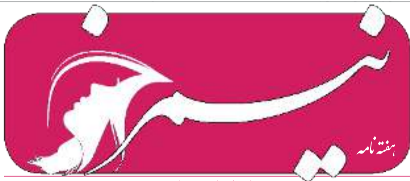
این جا، چراغی روشن است

■ سال دوم ■ شماره ۶۱ ■ سه‌شنبه ■ ۲۲ عقرب ۱۳۹۷ ■ قیمت ۱۰ افغانی ■ Monday ■ November 13, 2018 ■ Vol. 2 ■ No. 61