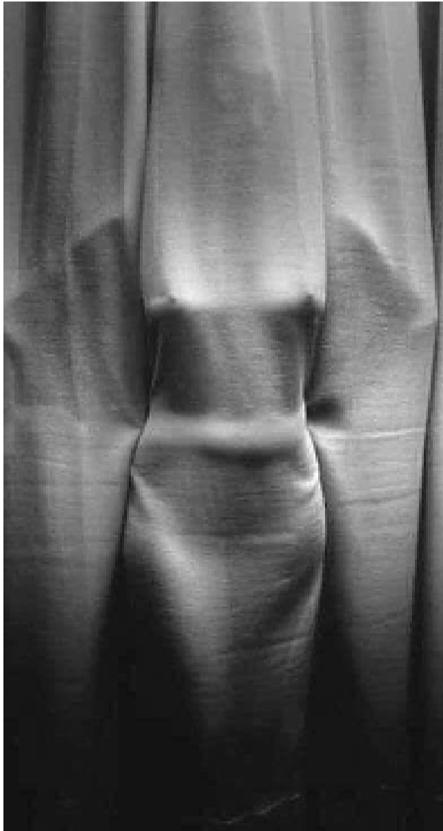
کارشناسان مطالعات زنان و جنس، پزشکان طب فامیلی، فمینیست‌ها و فعالین حقوق زن و کسانی که

افتخار است، ماده بودن برای زنان چرا ننگ باشد؟ این روزها در رسانه‌ها به ویژه در رسانه‌های اجتماعی سخن گفتن از تن زن به چالش تبدیل شده، اما مشکل این‌جاست که سخن گفتن از تن زن به گونه‌ی امروزی‌اش ره به بی‌راهه می‌برد.