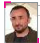
تحلیل یعقوب یسنا

معامله‌ی زنان در دعوای و نزاع‌ها در فرهنگ مردسالار عرف است. به این عرف «بد دادن» گفته می‌شود. اصطلاح بد دادن عرفی است که معمولاً در نزاع‌های قتل، نزاع‌های ناموسی مانند رفتن یک زن از یک قبیله با مرد یک قبیله‌ی دیگر یا رابطه‌ی نامشروع یک زن و مرد و... صورت می‌گیرد. برای رفع این نزاع‌ها زنان بین مردان معامله می‌شوند. به این معامله «بد دادن» می‌گویند. به این معنا که بد کار خود را پرداخت. مساله این است که اشتباه و خطا را مردان می‌کنند اما آسیب و ضرر را زنان متقبل می‌شوند. یک مرد کسی را می‌کشد. بنابراین به خانواده کشته‌شده باید خواهر یا دختر خود را بد بدهد. مهم این نیست که آن خانواده از این دختر چه بهره‌برداری می‌کند. ممکن یک مردی از آن خانواده با این دختر ازدواج کند، ممکن از این دختر در خانه به عنوان کنیز استفاده شود و مردان آن خانواده به این دختر تجاوز کنند. در کل دختر برای انجام